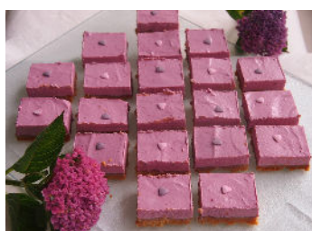
Petit fours met aardbeien