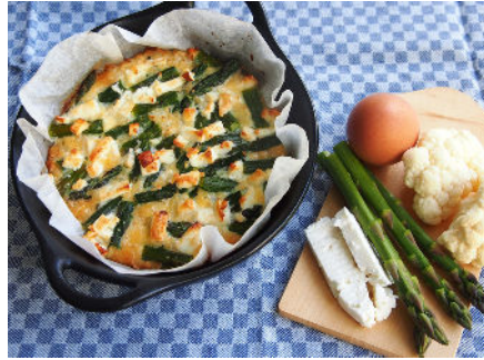
Quiche met groene asperges