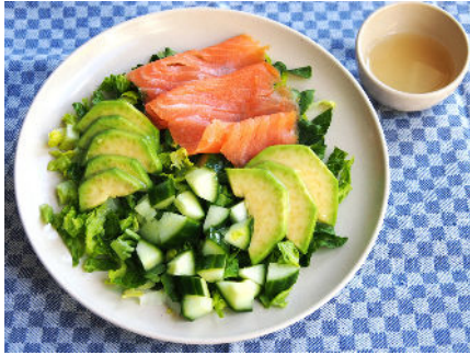
Salade met gerookte zalm